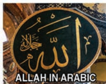
ALLAH IN ARABIC

Muslim: Ang siyang tagasunod sa mga kagustuhan ng Nag-iisa at Tunay na Diyos na si Allah, na Siyang Tagapaglikha.