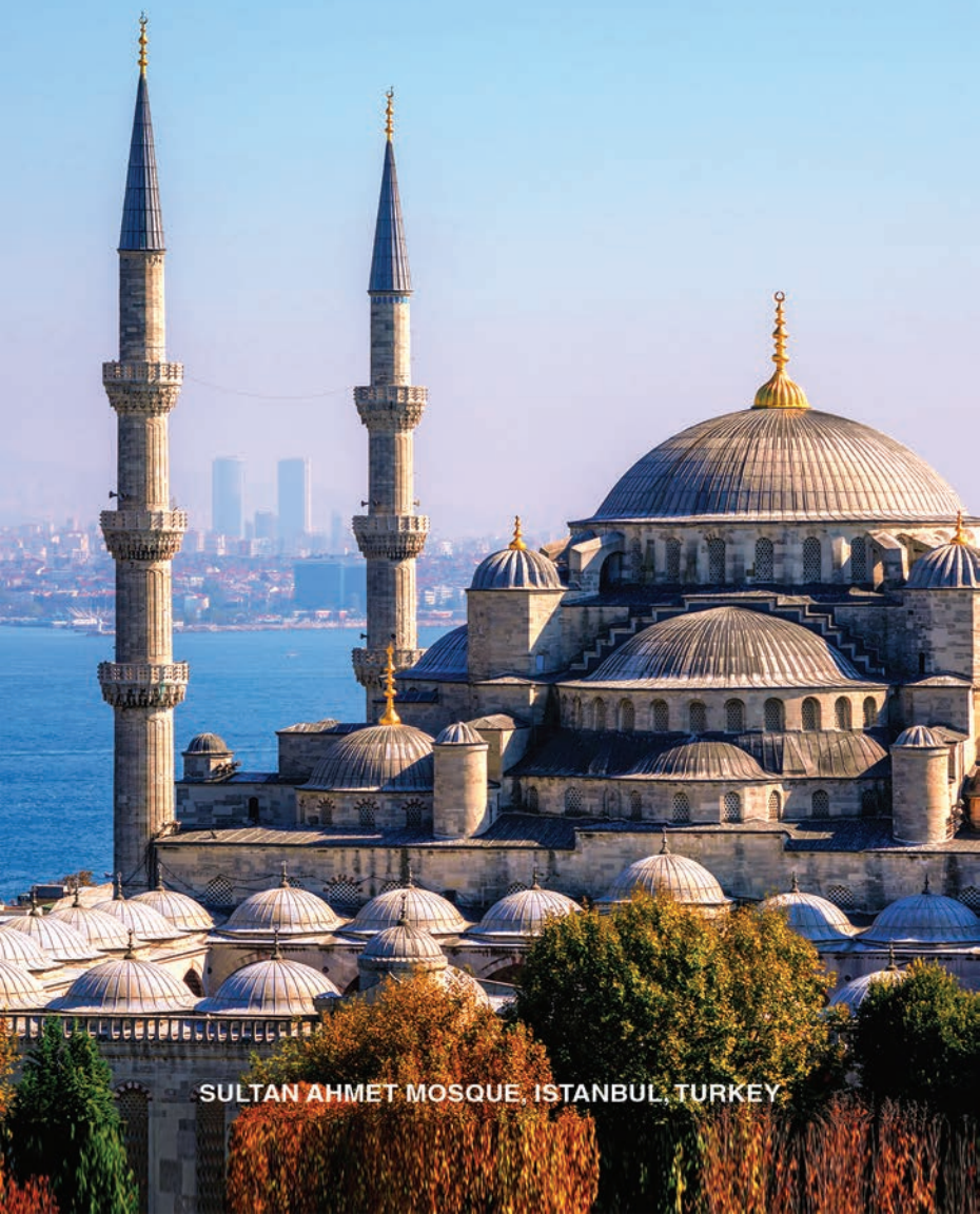
SULTAN AHMET MOSQUE, ISTANBUL, TURKEY