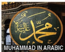
MUHAMMAD IN ARABIC