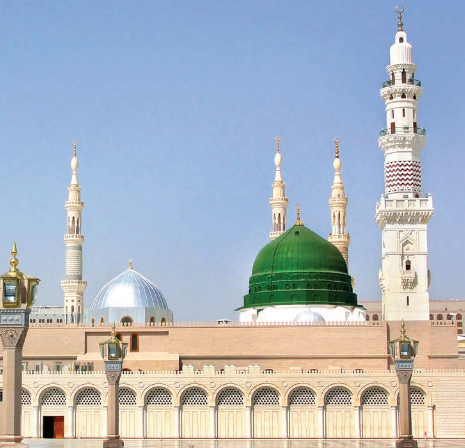
THE PROPHET'S MOSQUE, MADINAH, SAUDI ARABIA