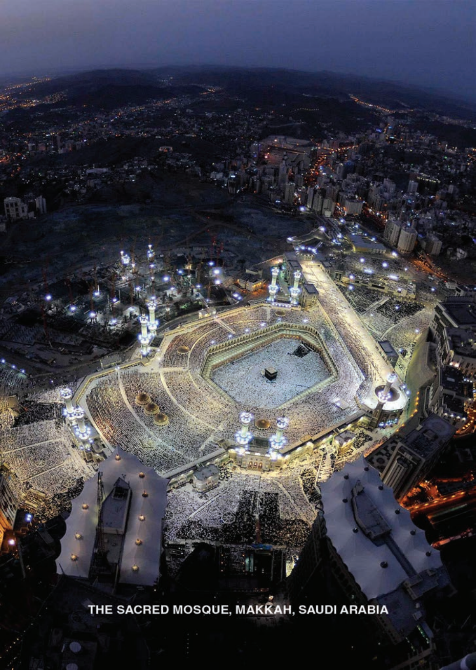
THE SACRED MOSQUE, MAKKAH, SAUDI ARABIA