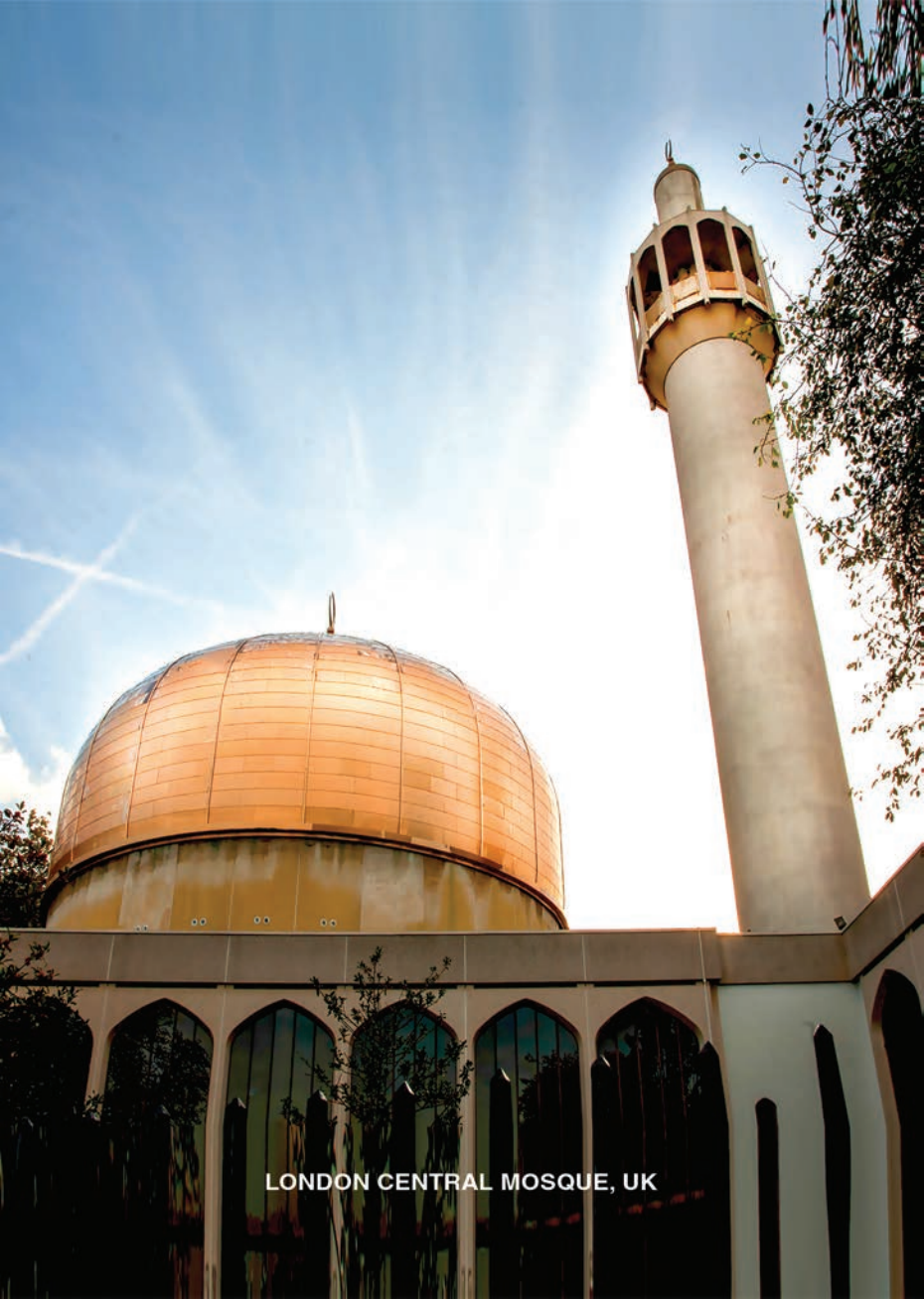
LONDON CENTRAL MOSQUE, UK