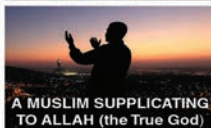
A MUSLIM SUPPLICATING TO ALLAH (the True God)