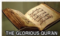
THE GLORIOUS QUR'AN