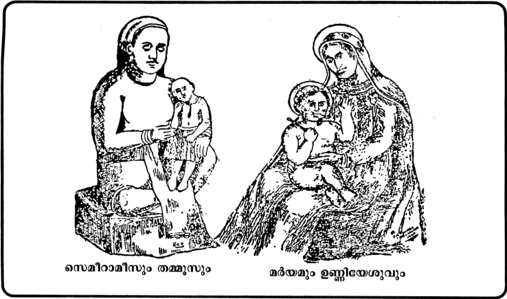
Kitto's Illustrated Commentary (Vol. IV.P.31) മഹതിയാം ബാബിലോൺ

ന്റെ കുരിശുമാർഗത്തെ വിളക്കിച്ചേർക്കുകയും അവിടെ നിന്ന് ഒരു നേർരേഖ വരച്ച് ഇന്നത്തെ ക്രിസ്ത്യാനികളിലേക്ക് എത്തിക്കുകയും ചെയ്തു. അപ്പോൾ ക്രിസ്തുവിൽ നിന്ന് ആരംഭിച്ച്, പന്ത്രണ്ട് അപ്പൊസ്തലന്മാരോടൊപ്പം പൗലോസും കൂടി ഒരുമിച്ച് പരിശ്രമിച്ച് വളർത്തിയെടുത്തതാണ് ക്രിസ്തുമതം എന്ന ഒരു വമ്പൻ കെട്ടുകഥ ക്രൈസ്തവ ചരിത്രകാരന്മാർ ലോകത്തിന് സമ്മാനിച്ചു. എന്നാൽ ബൈബിൾ നൽകിയ വിവരങ്ങളുടെ അടിസ്ഥാനത്തിൽ ഈ ചരിത്രം നിരൂപണവിധേയമാക്കിക്കൊണ്ട് പുനരന്വേഷിച്ചപ്പോൾ ലഭിച്ച സത്യസന്ധമായ വിവരണമാണ് ഇപ്പോൾ നിങ്ങൾക്ക് മുമ്പിലുള്ളത്.