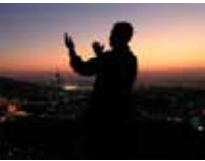
አላህን (እውነተኛውን አምላክ) የሚማፀን ሙስሊም