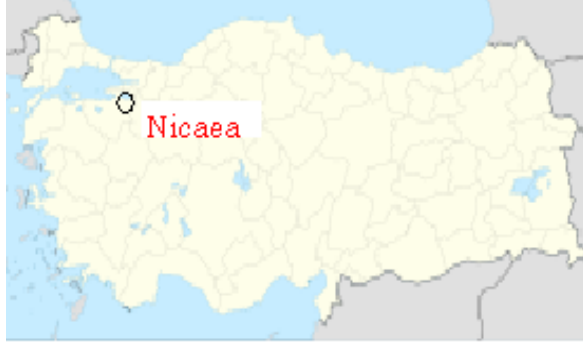
مكان مدينة نيقية Nicaea بإقليم مرمرية بتركيا

ولقد لخصت الموسوعة البريطانية 1968 إجراءات مجمع نيقية كالآتي: انعقد مجمع نيقية في 20 مايو 325 م . وتولى قسطنطين رئاسة المجلس بنفسه، وبهمة أدار النقاش، واقترح بنفسه ولاشك في دور "أوسيو" الذي قام بتلقيق قسطنطين الصيغة الصليبية الحاسمة التي عبّرت عن العلاقة بين المسيح والرب في العقيدة التي صدرت عن المجمع "من جوهر واحد مع الآب" وتحت ضغط و إرهاب الإمبراطور، وباستثناء اثنين من الأساقفة، وقع الأساقفة على العقيدة وكثير منهم كانت العقيدة ضد ميولهم. اعتبر قسطنطين أن قرار مجمع نيقية جاء بإلهام رباني، وطوال ما كان على قيد الحياة لم يجرؤ أحد أن يتحدى بصراحة عقيدة نيقية. إلا أن الإتفاق الذي كان منتظراً لم يتحقق فيما بعد.